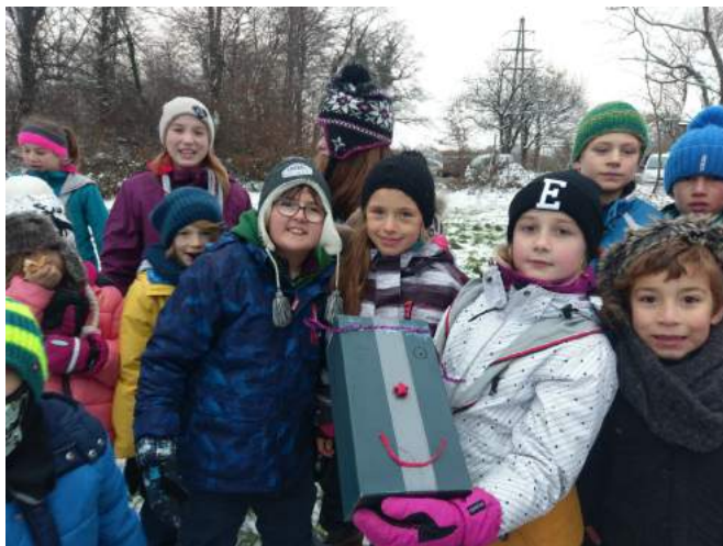
Aktivität mit Baregg und Hochwacht

Nach einigen Jahren Pause wollten wir die PTA-Benefizparty in neuem Kleid wiederbeleben. Die Leitenden der PTA-Stufe