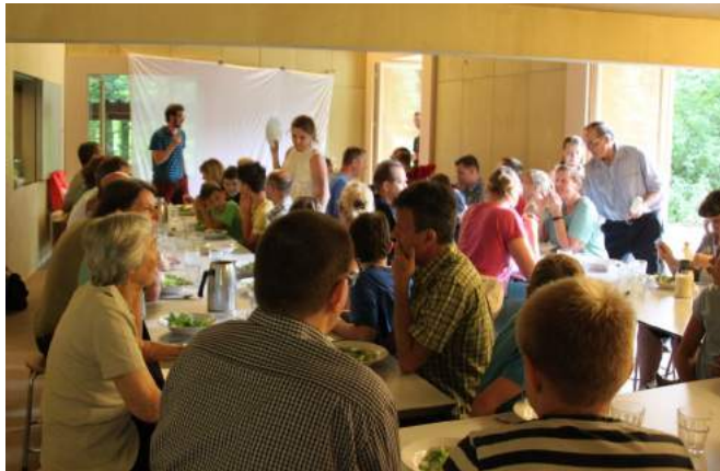
Full House am Spaghettiplausch

Ein weiterer Fixpunkt im PTA-Jahr ist der Spaghettiplausch. Dieses Jahr hat er als Ausklang vor den Sommerferien stattgefunden.