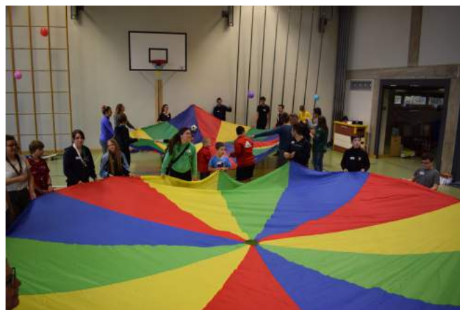
Sportnachmittag in Gösgen

Am 18. November waren wir zu Cassiopaya's Sportnachmittag in Niedergösgen eingeladen. Im Rahmen ihrer Maturaarbeit