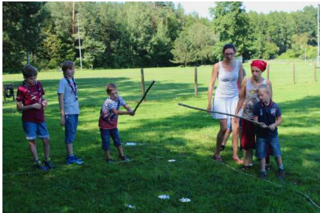
Sola in Winterhur

Nachdem die PTA Baden ein Hilferuf per Flaschenpost erreicht hatte, machten sich sieben mutige Pfadfinder, eine