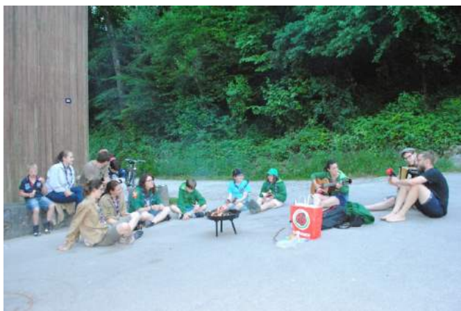
Taufe und Singsong

Das Abendessen blieb jedoch nicht das einzige Highlight des Abends. Wie es bei uns Tradition hat, werden in den Lager jene