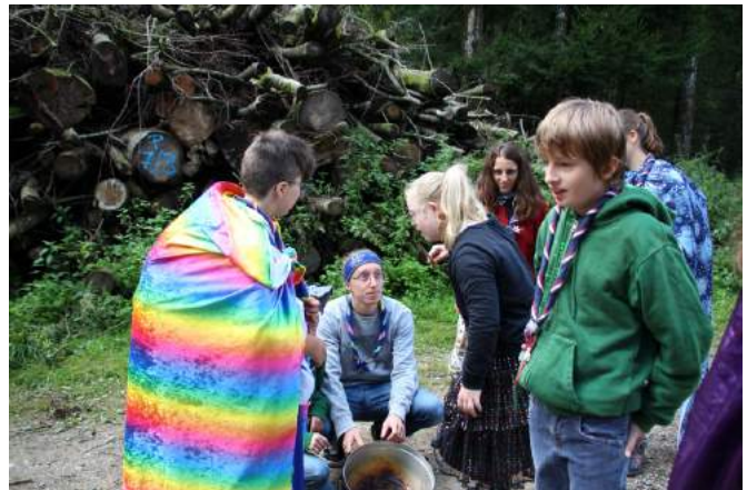
Bei Harry Botter

Anfang September sollte in Wohlen eigentlich das bottastische Turnier stattfinden. Zu so einem Turnier gehört auch ein