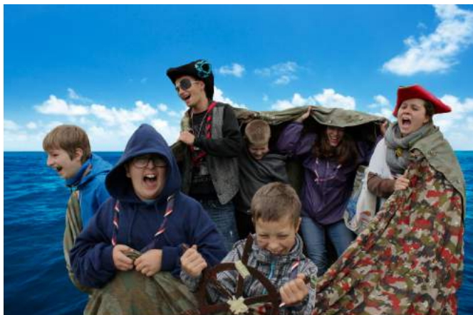
Piraten auf hoher See

So standen Themen der Individualität, des Respekts und Zusammenhalts sowie des Konfliktlösens neben den sportlichen,