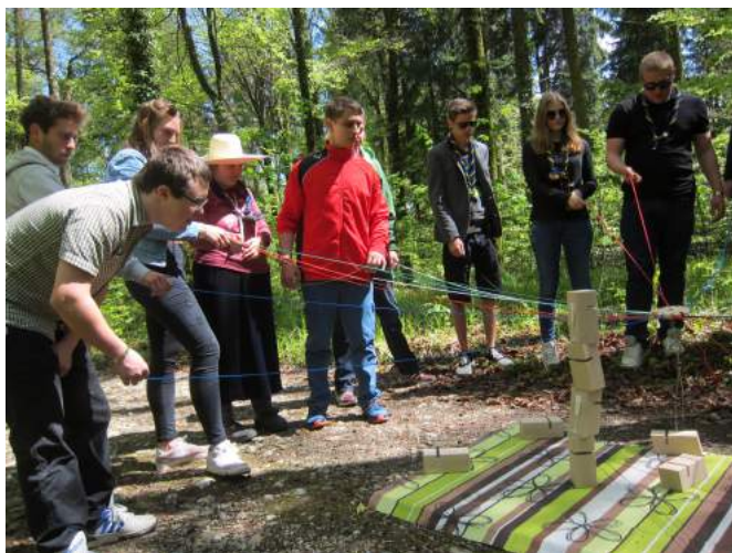
Impression vom RoHo

Im Mai stand das Roverhorn an. Dieser kantonale Wettkampf zwischen Gruppen von Rovern, sogenannten Rotten, ist im