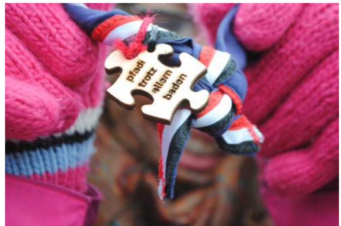
Foulard / Krawatte der PTA Baden