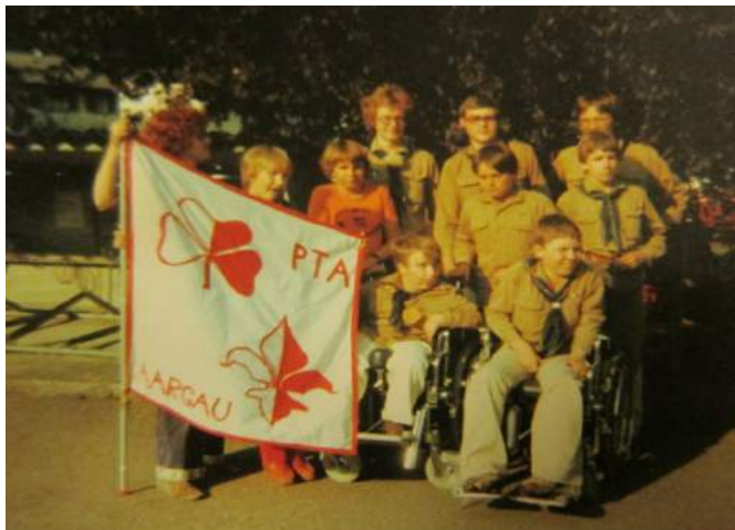
Ein frühes Gruppenfoto der PTA Aargau

Seit längerem wussten wir, dass unsere Statuten eine Überarbeitung brauchen. Dabei haben wir gemeinsam mit der Abteilung