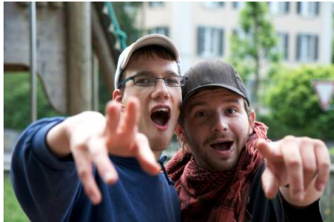
Wieso und Athos

Am 21. Mai 2016 ist Athos für uns alle unerwartet verstorben. Die Nachricht von seinem Tod hat uns tief betroffen und unglaublich traurig gemacht. Athos hat sich seit 2007 in der PTA engagiert und gewirkt. Mit seiner herzlichen Art und seinem