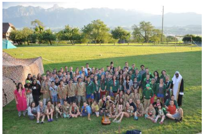
Im Sommerlager 2016 mit der Pfadi Wohle

Lange haben wir euch verträsten müssen, einige haben schon persönlich angefragt, wie es denn im Sommer mit einem Lager