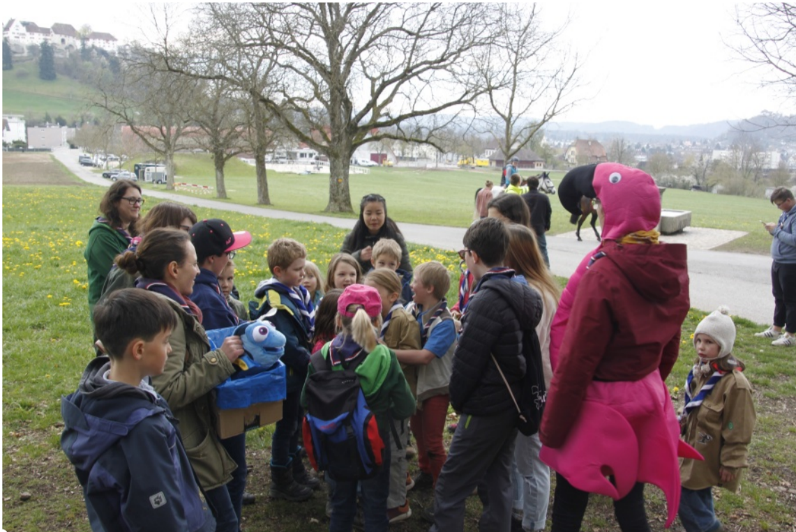
Aktivität mit der Wolfsstufe Lenzburg

ihren Freund Nemo wiederzufinden. Auf unserer Suche nach dem Teich trafen wir bei verschiedenen Aktivitäten