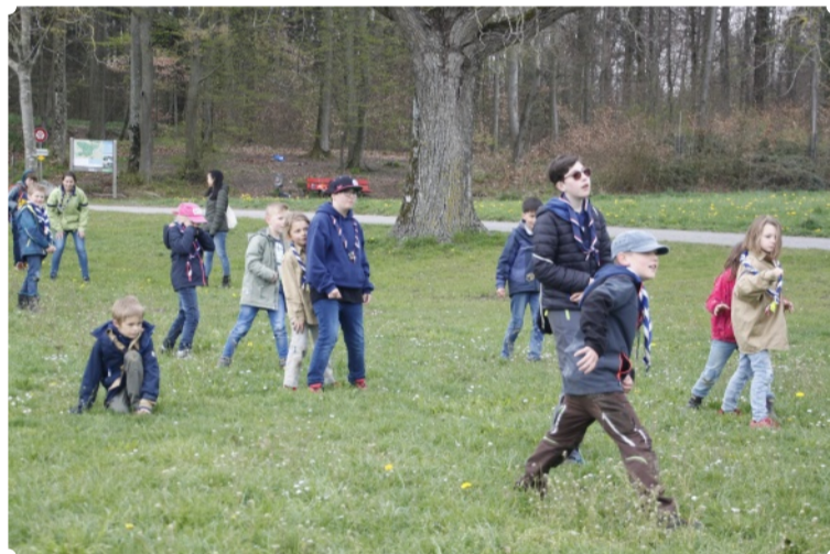
Sportliche PTA Stufe

Wir erhielten einen Brief von Dorie, der besten Freundin der Clownfische Nemo und Marlin. In ihrem Brief schrieb sie, dass sie unbedingt Hilfe braucht, damit sie ihren Freund Nemo wiederfinden kann. Gesichtet wurde er das letzte Mal in einem kleinen Teich, den es jetzt zu suchen gilt. Hilfsbereit wie die Pfadi ist, erklärten wir uns sofort dazu bereit, ihr tatkräftig zu helfen, um