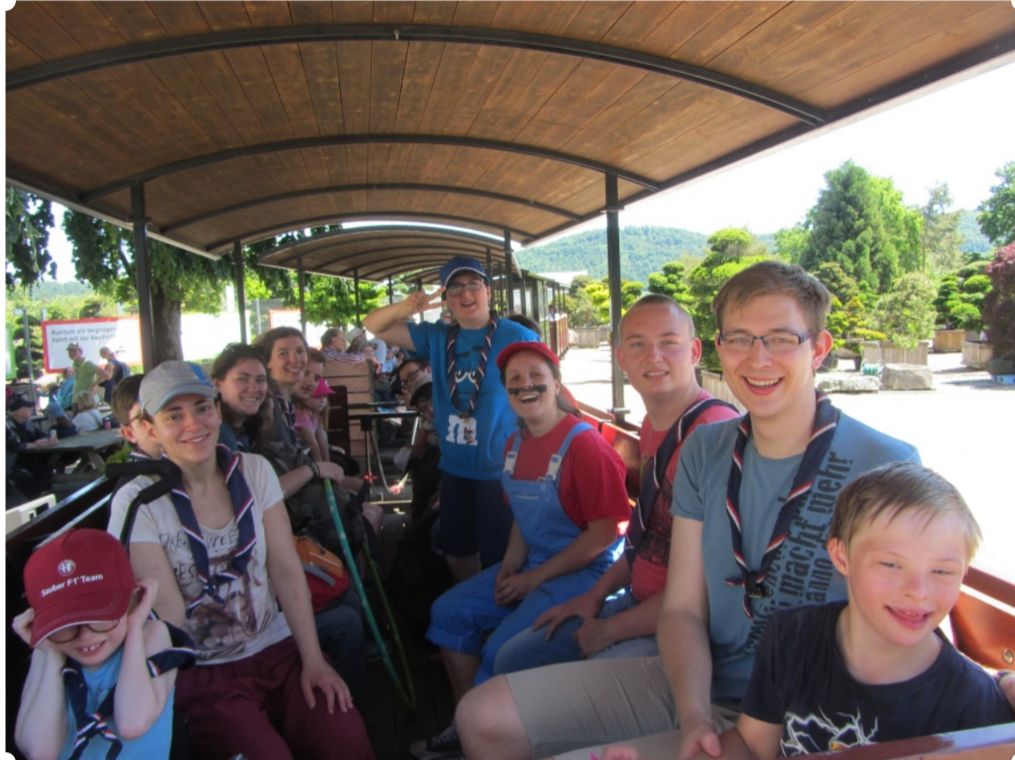
Die Fahrt in der Baumschulbahn

Zu seinem Bruder könne er nur finden, wenn er es schaffen würde, alle Levels erfolgreich zu absolvieren – klar ist da die PTA sofort zur Stelle, um ihm behilflich zu sein! Unser AuLa begann bei der Badi Schinznach-Dorf. Mario erklärte uns, wie das Spiel genau funktioniert: Nach jedem erfolgreich gemeisterten Level erhält man einen Kartenausschnitt, welcher zeigt, wo das nächste Level zu finden ist. Das erste Level begann sogleich: wir machten uns auf den Weg und folgten den auf dem Boden ausgelegten Spuren. Das Büchlein «Gueti Jagd» half uns den richtigen Weg zu finden und nicht aus Versehen auf Umwege zu geraten. Bald erreichten wir das Gartencenter Zulauf, wo wir unter musikalischer Begleitung der Mario-Melodie bereits zum zweiten Level