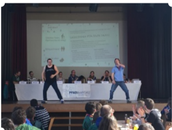
Performance der Rover an der DV: DJ Bobo Choreografie

Die Delegiertenversammlung der Pfadi Aargau findet jeweils im Frühling statt. Organisiert wird der Anlass jeweils von einer Abteilung im Kanton. Die DV vom 16. März 2019 fand in Wohlen statt – organisiert von der PTA Baden. Am Anlass verabschiedeten die 66 anwesenden Delegierten die Jahresrechnung und das Budget. Zudem wählten sie zwei neue Mitglieder in die Kantonalleitung und drei in den Vorstand. Für die PTA war der Anlass eine willkommene Gelegenheit für Integrationsarbeit sowie eine Werbemassnahme für zukünftige Leitende. Mit den oben abgebildete Fähnchen haben wir beim Znüni für unser Leitungsteam gewonnen. Die Tanz Performance unseren beiden Rover Avanti und Twike vor vollem Saal haben dann die restliche Überzeugungsarbeit geleistet.