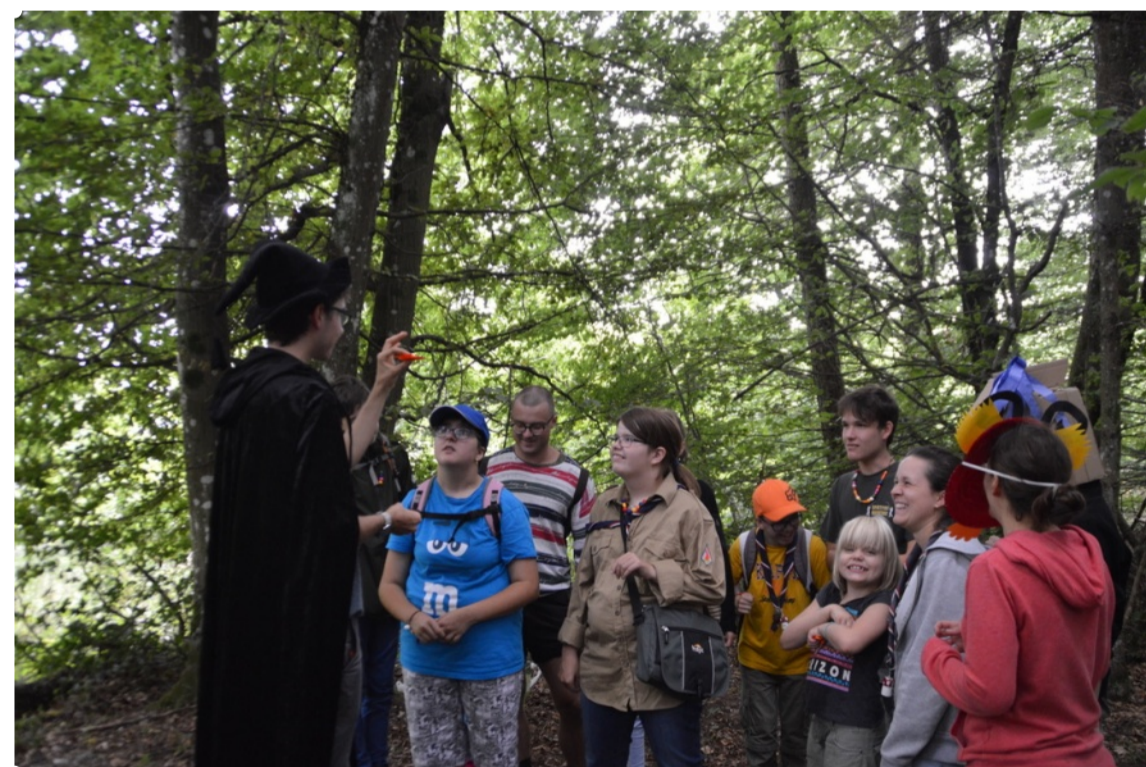
Die PTAs müssen dem mächtigen Zauberer ihre Zauberfähigkeiten beweisen

Wir entdecken einen traurigen Drachen, der sein magisches Amulett und somit seine Flugfähigkeit verloren hatte. Während seines Flugs hatte Hatschi auf einmal einen Niesanfall, wobei auf ganz ungeschickte Weise sein Amulett runterfiel und er dieses nun nicht mehr finden konnte. Nach seiner bisher erfolglosen Suche wollten wir ihm nun gerne helfen ein neues Amulett herzustellen. Wir begaben uns auf die Suche nach verschiedenen magischen Zutaten und die Herstellung des Amuletts gelang! Bei einer weiteren Aktivität stellte Hatschi jedoch fest, dass er mittlerweile leider schon so lange nicht mehr geflogen war und nun dummerweise das Fliegen verlernt hatte. Die PTA versuchte dem Drachen behilflich zu sein, damit er seine Flugkünste wiederzuerlangen konnte, indem sie beispielsweise mit ihm trainierte, einen Piloten um Tipps bat und