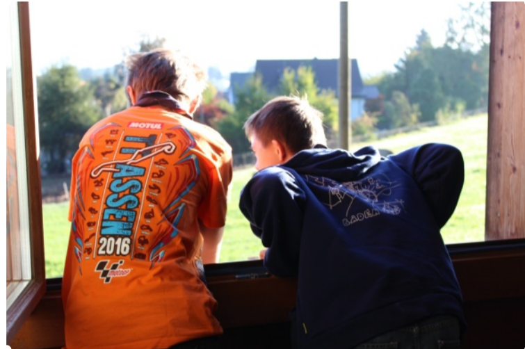
Morgenstimmung im Hela

bewiesen wir dem Traumjäger allerdings, dass er es nicht einfach mit irgendjemandem, sondern mit der PTA Baden, zu tun hat! Wir handelten mit ihm einen Deal aus: Wenn wir