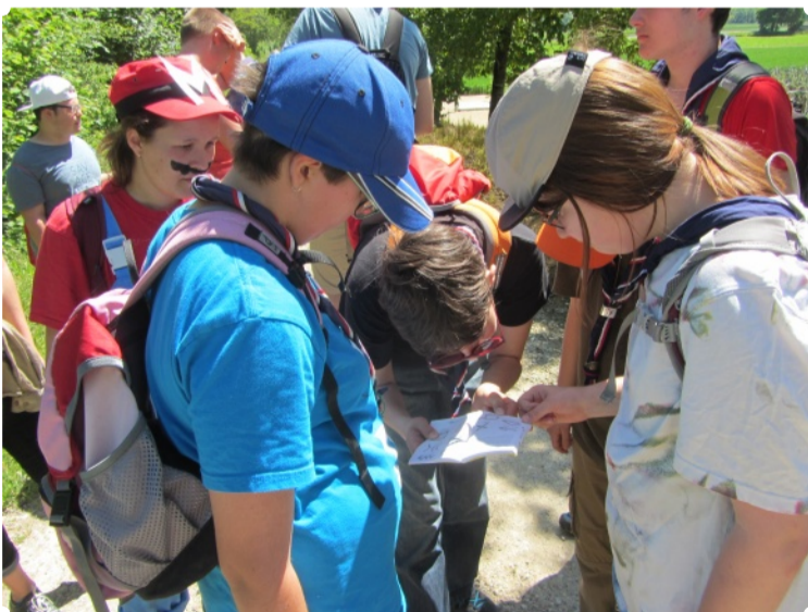
Das Kartenlesen fordert...

sich langsam und unter der musikalischen Begleitung der Mario-Titelmelodie die Tür zum Pfadiheim und heraus trat der freudestrahlende Luigi. Vor Freude seinen Bruder wiederzusehen und alle Levels erfolgreich gemeistert zu haben, lud uns Mario zum Abendessen ein, denn dieser Erfolg musste gebührend gefeiert werden. Da wir alle schon einen Bärenhunger hatten von der langen Reise und den harten Proben, auf welche wir gestellt wurden, traf es sich äusserst gut, dass Luigi gemeinsam mit seinen Helfern bereits Lasagne und Risotto gekocht hatte. Mario fand, dass wir eigentlich auch gleich bei ihnen im Haus übernachten sollten, da es schliesslich Platz genug für alle habe. Weil wir schon ziemlich erschöpft waren, nahmen wir die Einladung dankend an. Abends nach dem Essen bastelten wir Souvenirs, die uns an Mario und Luigi erinnern sollten und sangen am Lagerfeuer einige Lieder. Nach dem gemütlichen Zusammensein fand so unser Tag ein Ende. Glücklicherweise gingen wir zu Bett.