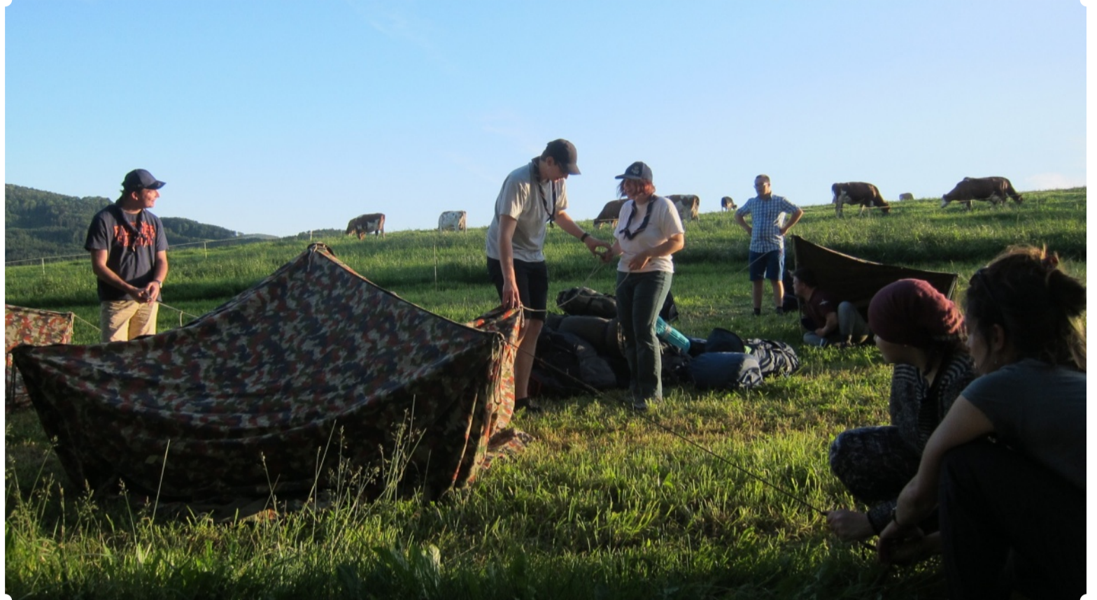
Aufstellen der Berliner

... det stod ke wissi Geiss, aber dafür Kühe und ein paar Pfadizelte.