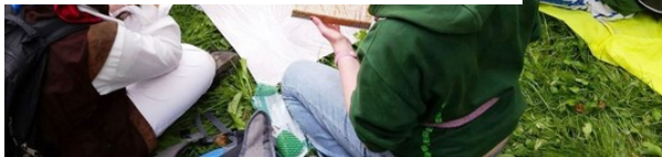
Die «Pfadi Trotz Allem» bietet ein Erlebnis wie jede andere Pfadi. HO

Mit diesem Gutscheibuch wird Ihnen bei jedem Restaurantbesuch ab 2 Personen eine Hauptmahlzeit offeriert! Ihr Geschenk - Das Gutscheibuch. Nur CHF 69.- pro Buch. Zum Angebot